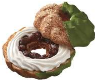
ドーナツシュー 宇治抹茶あずき (183 円)

ふんわりもっちりとしたシュー生地に、あずきとホイップクリームをサンドし、祇園辻利の宇治抹茶を使用した抹茶チョコでコーティングしました。