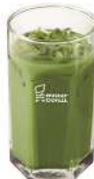
宇治抹茶オレ (302 円)

祇園辻利の宇治抹茶を使用したドリンク。抹茶とミルクのバランスがよく、抹茶の香りとミルクのコクを感じられるように仕上げました。