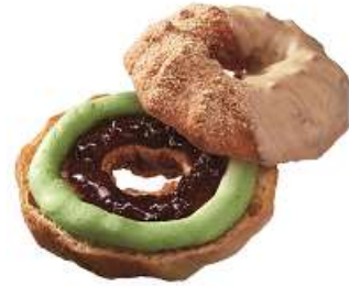
ドーナツシュー 宇治抹茶黒蜜 (183 円)

ふんわりもっちりとしたシュー生地に、黒蜜ジュレと祇園辻利の宇治抹茶を使用した抹茶ホイップをサンドし、きなこチョコでコーティングしました。