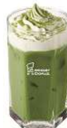
宇治抹茶オレホイップ (356 円)

祇園辻利の宇治抹茶を使用したドリンク。抹茶とミルクのバランスがよく、抹茶の香りとミルクのコクを感じられます。ホイップクリームを混ぜることで、まろやかな口当たりになり、より飲みやすくなるように仕上げました。