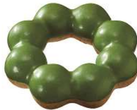
ポン・デ・ダブル宇治抹茶 (151 円)

祇園辻利の宇治抹茶を練り込んだもちもち食感のポン・デ・リング生地に、祇園辻利の宇治抹茶を使用した抹茶チョコをコーティングしました。