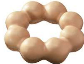
ポン・デ・宇治抹茶きなこ (151 円)

祇園辻利の宇治抹茶を練り込んだもちもち食感のポン・デ・リング生地に、きなこチョコをコーティングしました。