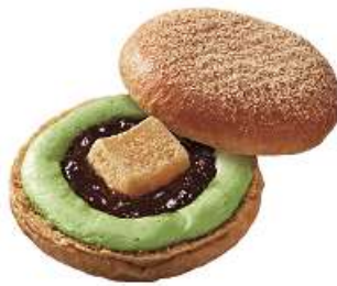
黒糖ドーナツ 宇治抹茶わらびもち (194 円)

黒糖を練り込んだイースト生地、黒蜜ジュレとわらびもち、祇園辻利の宇治抹茶を使用した抹茶ホイップをサンドし、最後にきなこシュガーをふりかけました。