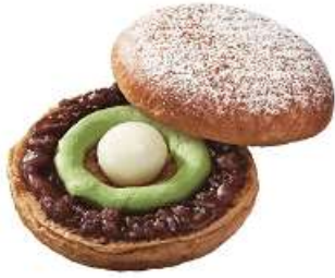
黒糖ドーナツ 宇治抹茶白玉 (194 円)

黒糖を練り込んだイースト生地、あずきと白玉、祇園辻利の宇治抹茶を使用した抹茶ホイップをサンドし、最後にシュガーをふりかけました。