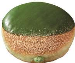
宇治抹茶ホイップ (151 円)

ふんわり食感のイースト生地に、祇園辻利の宇治抹茶を使用した抹茶ホイップを詰め、祇園辻利の抹茶を使用した抹茶チョコをコーティングして、きなこシュガーをふりかけました。