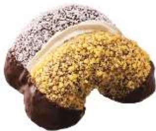
ゴールデン& ココナツチョコレート (151 円)

しっとり濃厚なチョコレート生地に、 カリカリ食感のトッピングとシャリ シャリ食感のココナツトッピングを 半分ずつ味わえるドーナツです。