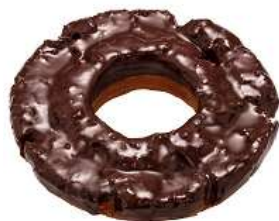
ベリーチョコファッション (151 円)