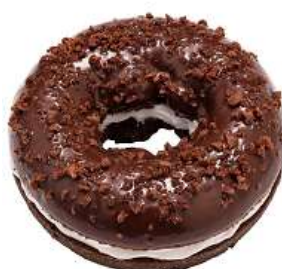
エンゼルダブルチョコレート (151 円)

しっとり濃厚なチョコレート生地に チョコレートコーティングし、ホ イップクリームをサンドしました。