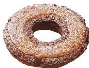
焼きカスタードファッション (140 円)

ミルク感のあるサクサクした生地 にカスタードクリームをのせてオーブ ンで焼き上げました。